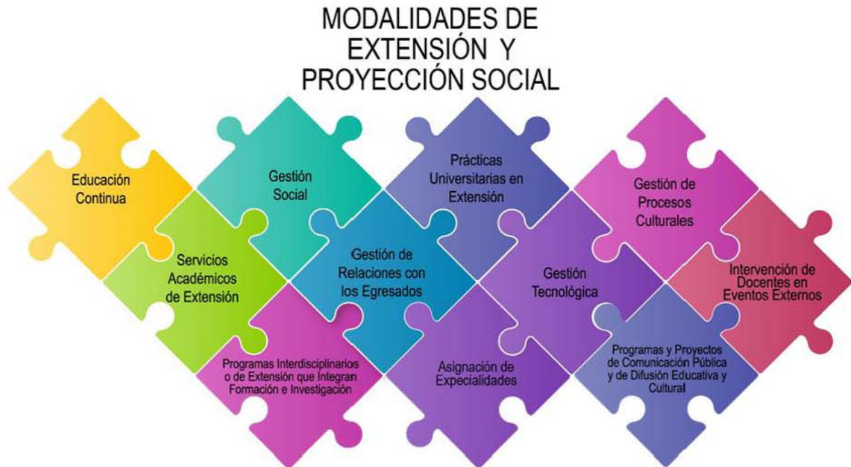
Figura 3. Modalidades de Extensión.

de responsabilidad de los grupos y/o secciones que la desarrollen y reportadas al Grupo Académico, Sección de Extensión para ingreso al Sistema de Información.