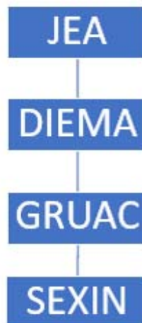
Figura 1. Estructura organizacional de la Extensión

La estructura Institucional de la Extensión es direccionada a través de la Jefatura de Educación Aeronáutica (JEA), quien imparte los lineamientos para la ejecución de la Extensión de acuerdo con la naturaleza de la Institucional así: